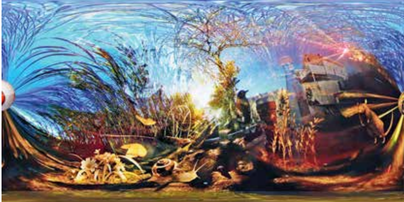
Imitating Nature Without Pity, 2018 360 derece sarmal video kolaj, dokunmatik ekran Dokunmatik ekran: 27", Video: 360 derece Ed 1/7