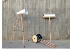
32, 38, 42 Başak Tuna, 2016 (çeşitli medya, 210cm. x 120cm. x 150cm.)